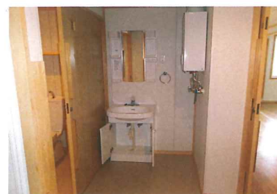
洗面脱衣室(ガスボイラー)