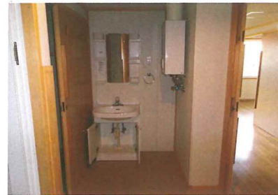
洗面脱衣室(ガスボイラー)