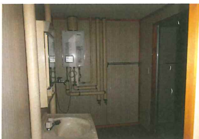
洗面脱衣室(ガスボイラー)