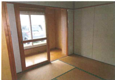
南側6畳和室+サンルーム